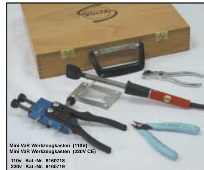
Mini VaR Werkzeugkasten (110V) Mini VaR Werkzeugkasten (220V CE) 110v Kat.-Nr. 8160718 220v Kat.-Nr. 8160719