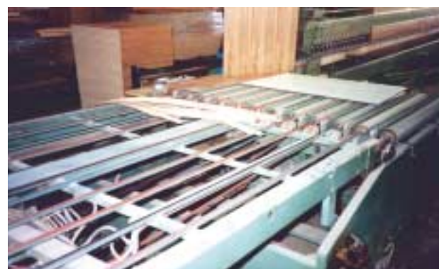
Holzindustrie - Holzbretter