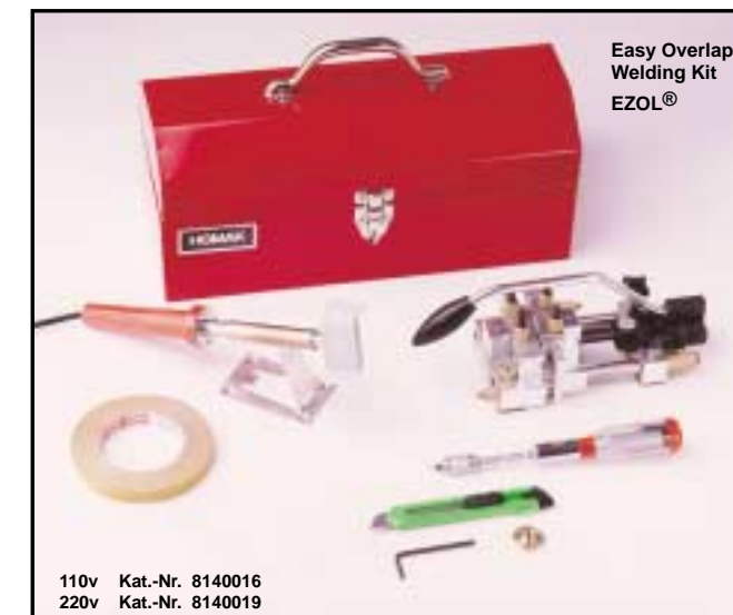
Easy Overlap Welding Kit EZOL®