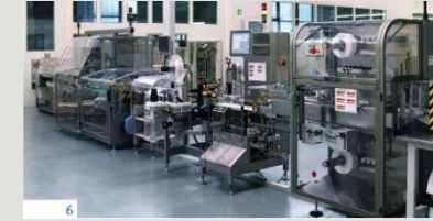
Track & Trace