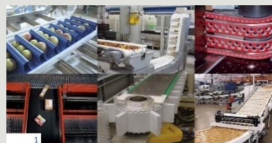
Bänder und Riemen

Wir bieten ein grosses Sortiment an Komponenten, Maschinen und Geräten, die Ihre Prozesse beschleunigen und deren Qualität verbessern. Für alles, was wir liefern, erhalten Sie auf Wunsch umfassende Beratungs- und Service-Dienstleistungen