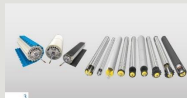
Trommelmotoren und Antriebsrollen